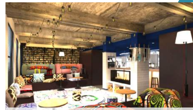
Mama Works – Lyon