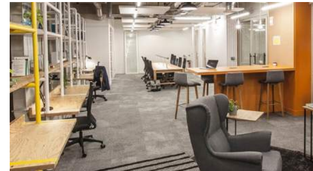
Nextdoor – La Défense